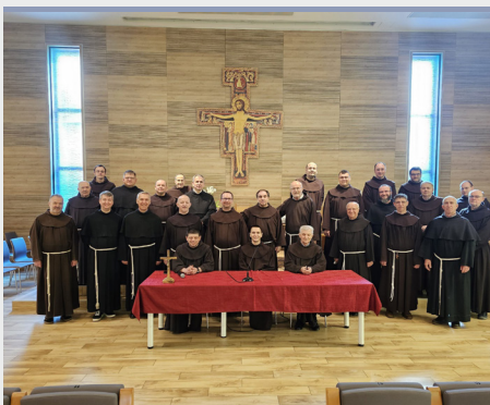
Curso para Asistentes espirituales OFS y JUFRA en las provincias croatas.